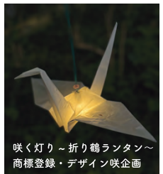
咲く灯り～折り鶴ランタン～ 商標登録・デザイン咲企画